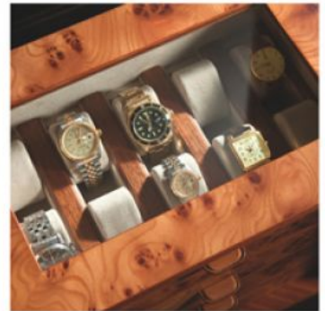
3728 石楠木手表盒, 可上锁, 可收纳28只手表, 或放支撑架或平躺

ASPETTO FRONTALE | FRONT VIEW | ФРОНТАЛЬНЫЙ ВИД | 内置正面图