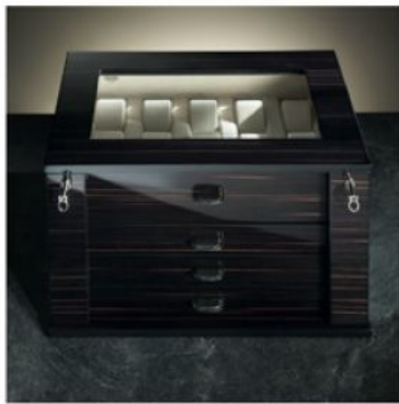
3828 Cassettoncino in ebano lucido, chiudibile a chiave, per 28 orologi su supporto e distesi.