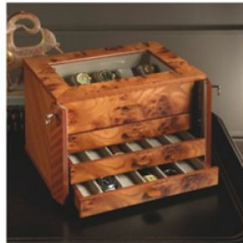
3728 Шкаф из радики, закрывающийся на ключ, для хранения 28 часов на подставках и непосредственно в коробочке.