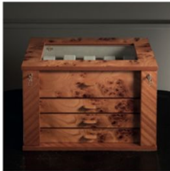
3728 Cassettoncino in radica chiudibile a chiave, per 28 orologi su supporto e distesi.