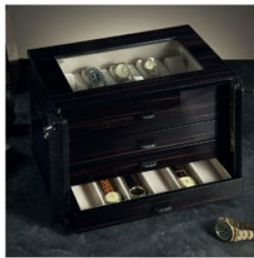
3828 Комод из полированного эбенового дерева, закрывающийся на ключ, для хранения 28 часов на подставках и непосредственно в коробочке.