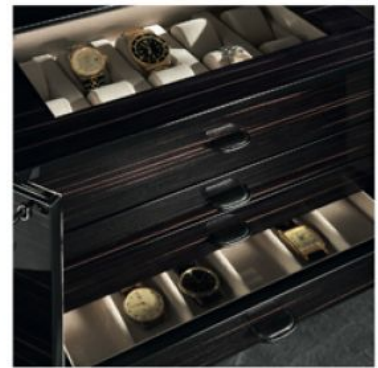
3828 抛光黑檀木手表盒, 可上锁, 可收纳28只手表, 或放支撑架或平躺。

ASPETTO FRONTALE | FRONT VIEW | ФРОНТАЛЬНЫЙ ВИД | 内置正面图